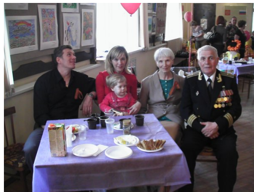
«И не прервать связующую нить»