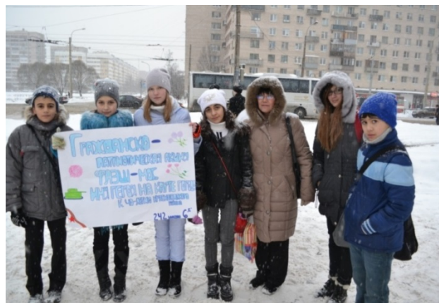
«Имя героя на карте страны»

Ресурсы поликультурной среды Санкт-Петербурга (направление «Мой город») способствуют формированию созидательного отношения ребенка к историческому и культурному пространству города.