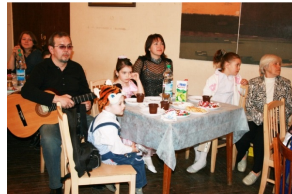
«В семейном кругу»

Примеры мероприятий: фестиваль творческих семей «Семья – дело творческое», конкурсы рисунков, сочинений, фотографий, компьютерных презентаций «Мама - главная профессия на Земле», «Если бы я был(а) папой (мамой)...», «Мама мамочки моей!», конкурсы «Реликвии моей семьи», творческие семейные вечера.