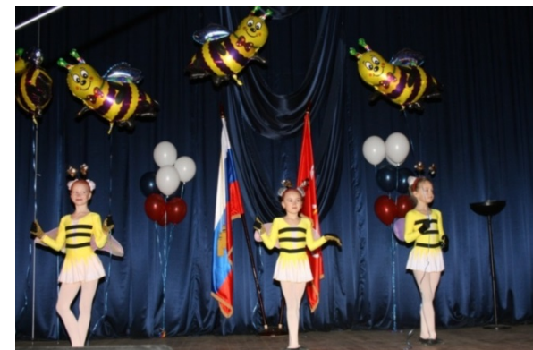
Межрайонные Южнобережные Олимпийские игры

Смотры–конкурсы творческих презентаций «Да здравствует ЗОЖ», детско-юношеских социальных проектов «Начни себя», конкурс социальной рекламы для старшеклассников «Открой глаза», интеллектуально-познавательная игра-конкурс «Мой дом – планета Земля», межрайонные Южнобережные Олимпийские игры.