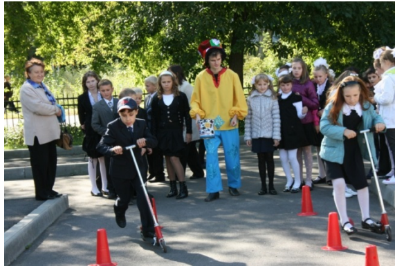
«Учение с увлечением»