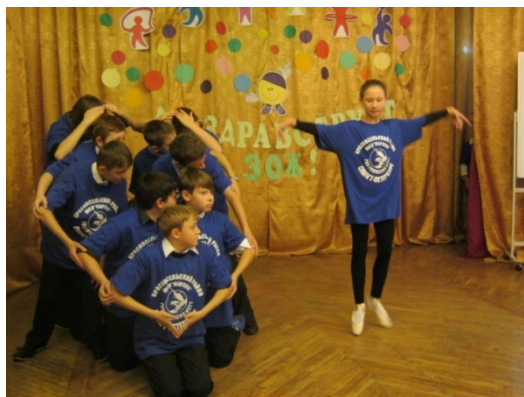
«Да здравствует, ЗОЖ!»