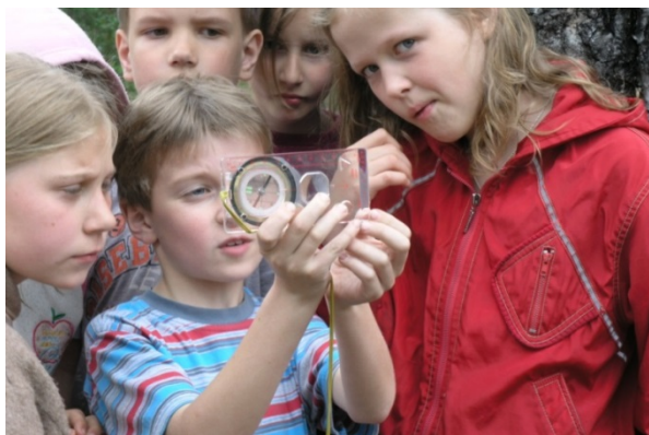
«Соревнования по спортивному ориентированию на Кубок ДДТ»

Пробуждение и поддержание интереса учащихся к здоровому образу жизни, самосовершенствованию осуществляется в досуговых мероприятиях направления «Путь здоровья»