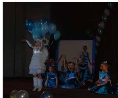
«Путешествие с Дюймовочкой»