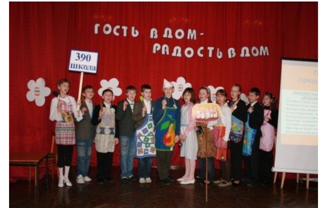
«Гость в дом – радость в дом»

Это игровые программы и игры-конкурсы для детей разных возрастных категорий: «Друзья дороги», «Дорожный патруль»; КВН по безопасности дорожного движения, конкурс агитбригад «Отряд ЮИД в действии».