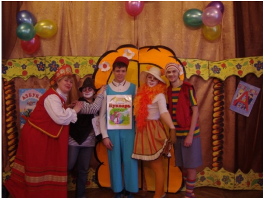
«Путешествие в сказочный мир книги»

Развитие социальной мотивации (интересов) в процессе реализации направления . Учащимся предлагается цикл организационно-массовых мероприятий, включающий конкурсные игровые программы, которые рассматриваются как первая ступень к выбору детьми своего увлечения, направления дополнительного образования и ориентированы на формирование потребности ребенка к дальнейшему самоопределению.