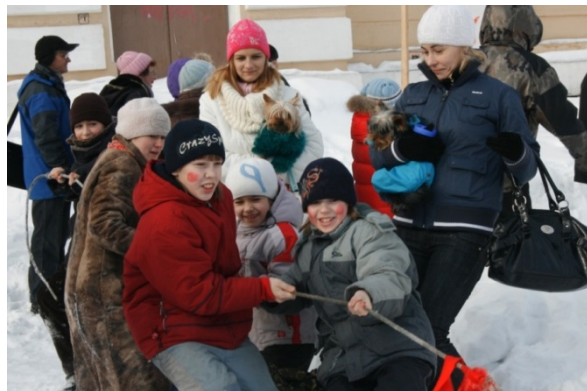
«Госпожа Широкая Масленица»

Направление «Мы вместе» создает условия для развития эмоционально-ценностного отношения к семейным традициям, формирования культуры досугового общения детей и родителей в процессе сотворческой деятельности.