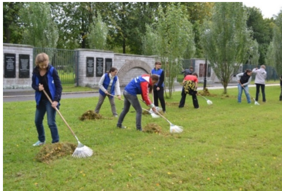
Трудовой десант на Пискаревском мемориале