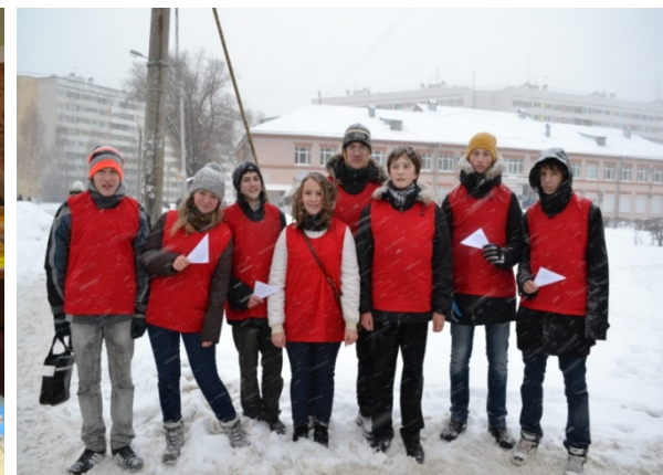
«Имя героя на карте страны»

В рамках данного направления проводятся конкурсы детских творческих и исследовательских работ, флеш-мобы, квесты, праздники, посвященные знаменательным датам Санкт-Петербурга и России. Значительное место в этом направлении занимают гражданско-патриотический проект «Имя героя на карте города».