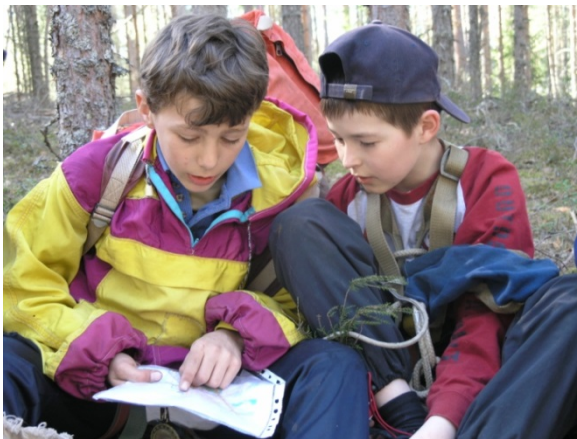
Весенний туристский слет