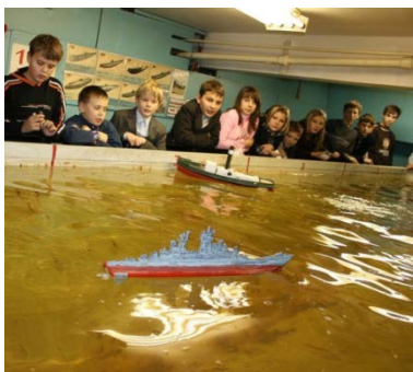
«Семь футов под килем»

Направления «Мир художественного творчества» и «Технология», с одной стороны, формируют творческую компетентность в различных видах художественно-творческой деятельности и технического творчества, с другой стороны, - социальную ориентацию «Я дарю своим творчеством красоту и радость людям».