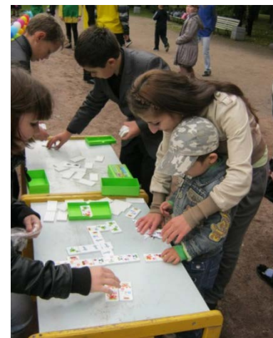
Праздник открытия спортивной площадки