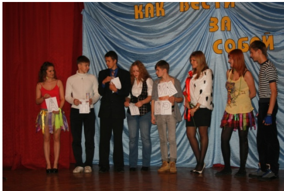
«Как вести за собой»

Созданию условий для включения учащихся в социально-значимую деятельность, становления молодежного добровольчества в образовательных учреждениях района, развития детского общественного движения и самоуправления способствует направление «Я отвечаю за...».