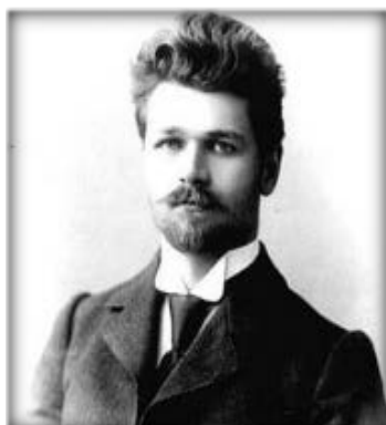
Станислав Теофилович Шацкий (1 (13) июня 1878— 30 октября 1934)