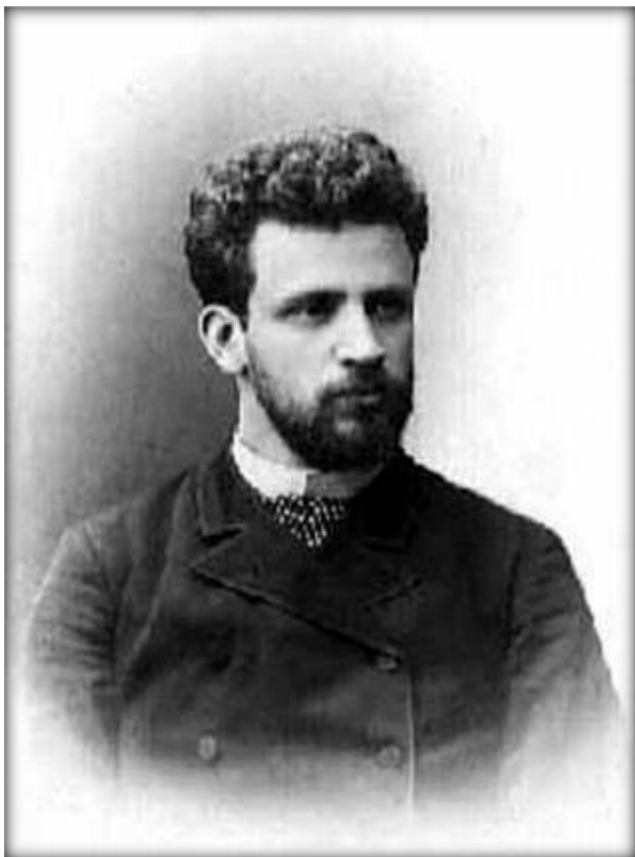
Константин Николаевич Вентцель (24 ноября (6 декабря) 1857 — 10 марта 1947)