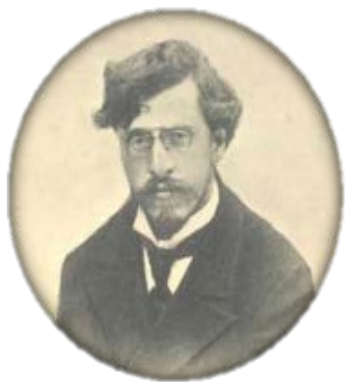
Александр Устинович Зеленко (11 октября 1871 — 21 июля 1953)