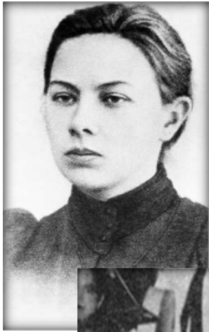
Надежда Константиновна Крупская (Ульянова) (14 (26) февраля 1869 — 27 февраля 1939)